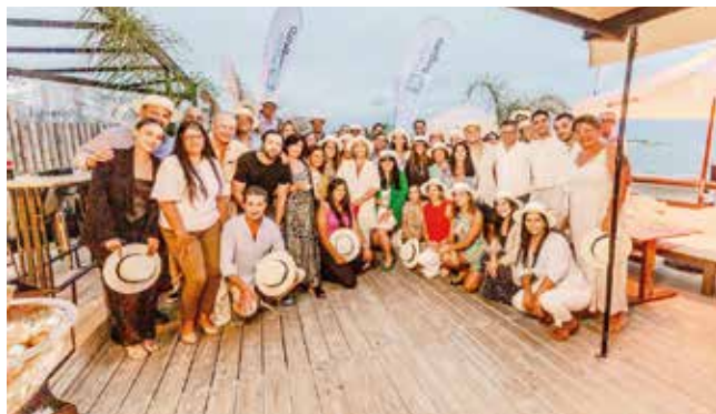
Evento de Porto Seguro en el parador Ímarangatú de Punta del Este.

Queremos agradecer a todos los que formaron parte de este encuentro. Su confianza y participación son el motor que nos impulsa a seguir innovando y ofreciendo lo mejor. 🌟